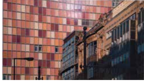
Ramazan Bayrakoğlu, İsimsiz, Pleksi üzerine akrilik, 280x157 cm