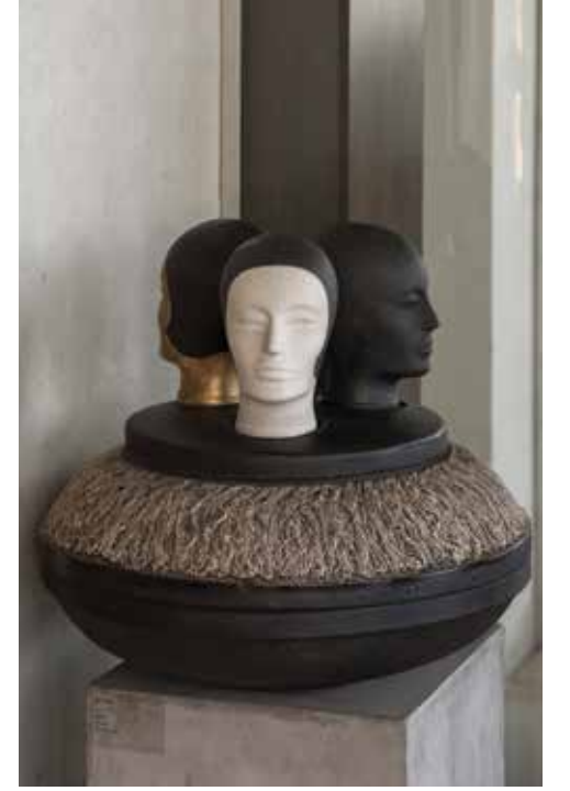
İlgi Adalan, İsimsiz, seramik ve bronz, 60x60x60 cm