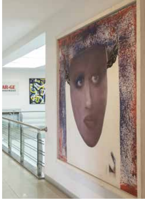
Komet, İsimsiz, tuval üzerine karışık teknik, 185x185 cm