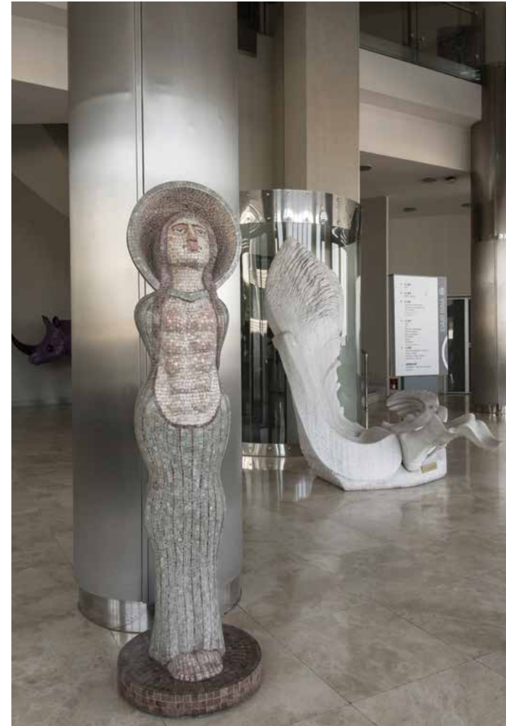
Rasim Konyar, Ana, Seramik, 155x45x45 cm