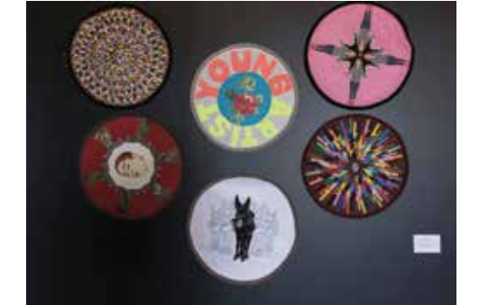
Ümmühan Yörük, 'Bunu neden yapıyorum?' serisinden, tekstil üzerine karışık teknik