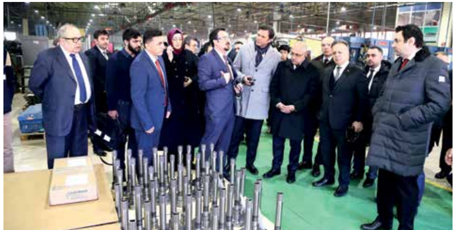
TİM, Ocak ayı ihracat verilerini Hema Endüstri'nin Tekirdağ Çerkezköy'de bulunan fabrikasında açıkladı. TİM Başkanı ve beraberindekiler etkinlik sonrası fabrikayı ve ürünleri inceleme fırsatı buldu.